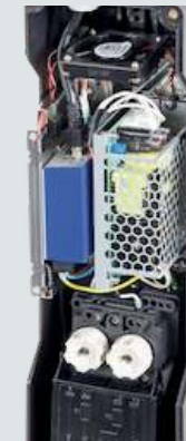
Anschlusskasten mit Medienkonverter