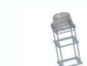
Fußplatte & Fundamentanker